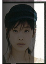
女優・モデル 高橋愛さん

④丸みのある形がキュート。ライトが7色に変化し、部屋の雰囲気も変わる。アロマディフューザー ¥5,500 / アフタヌーンティー・リビング