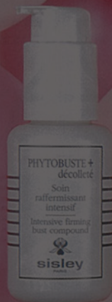
No.1 シスレー フィットビュスト+